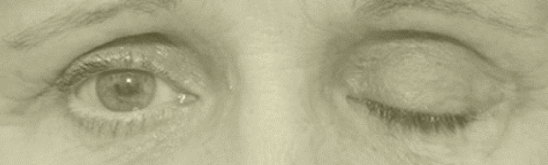
Slika 2 Povešena leva veka pri bolniku z očesno obliko miastenije gravis

Ta izraz sicer ponazarja utrudljivost in šibkost mišic, ki jih oživčujejo nekateri možganski živci, vendar pa ni najbolj točen, saj ne gre za prizadetost teh možganskih živcev ali jeder, iz katerih izhajajo, temveč za prizadetost prehoda impulza z živca preko kemičnega prenašalca (acetilholin (Ach)) na t. i. motorično ploščico prečno progaste mišice (slika 1).